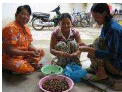
おいしそうな?! コオロギ君・・・

カンボジアの人たちは虫と共に生きていると言っても過言ではない。ある日隣りに住んでいる大家さんが庭先でモゾモゾ動く籠いっぱい虫の羽を一匹一匹丹念にむしっていた。聞くと、土の下から掘りおこして集めたコオロギだと言う。（ゴキブリ君でなくて一安心）このコオロギ君、羽を取って内臓を抜いた後、ニンニクと油に漬け、塩と砂糖でさらに揉んだものを揚げて食べるととてもおいしいのだそう。