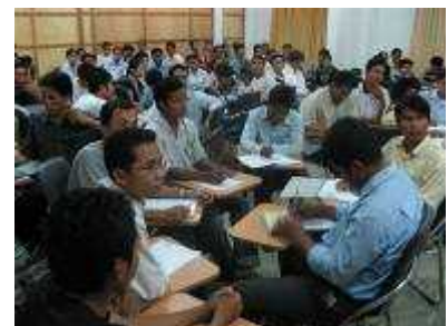
「ボランティア」について グループで話し合い

カンボジアにおける未来のユネスコ活動の担い手となる人材がこの大学から生まれるかも知れません。