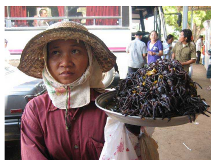
路上でタランチュラを売る女性

内心ビクビクしながら写真を撮っている私に「一緒にやらない?」と笑顔でコオロギ君を差し出してきた大家さん（写真上・左）に、「いつか勇気が出たら!」と苦笑いで返す私。カンボジアでは、蛙や蜘蛛の揚げ物を普通に食べる人たちがたくさんいる。特に蜘蛛の揚げ物（タランチュラ）は見た目にもグロテスクで、怖くてまだとても食べる勇気はない。でもいつか、いつかは試してみたいと思う。