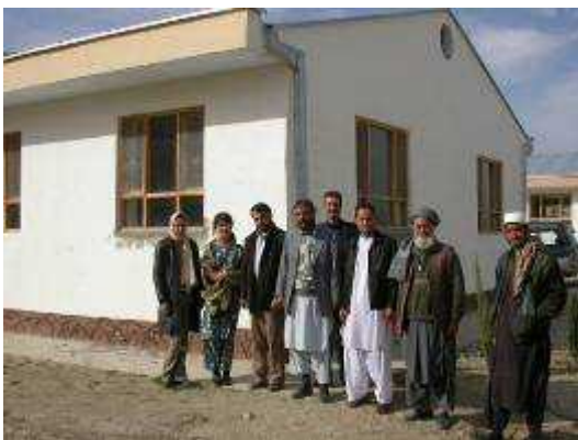
診療所兼図書室の外観

チャラシアブ村では2004年から教育支援活動が始まり、239名の人々が識字者（読み・書き・計算ができる人）になりました。この村の人たちは大変勉強熱心で、識字者になった後も、「自分で本を読んで勉強したい」、「子供にお話を読んであげたい」と願う学習者が多くいます。そこで、村人たちに図書室の場所を探してもらうことを条件に、本や新聞、雑誌などの購入を約束し、早速村人たちは、女性にも通いやすい場所を探し始め、モーニングスターというカナダのNGOが支援する診療所の一室を借りることができました。今では、新聞や女性誌、趣味の本や絵本などが図書室に設置され、寺子屋の学習者だけでなく、地元の人たちが立ち寄る場所になりつつあります。